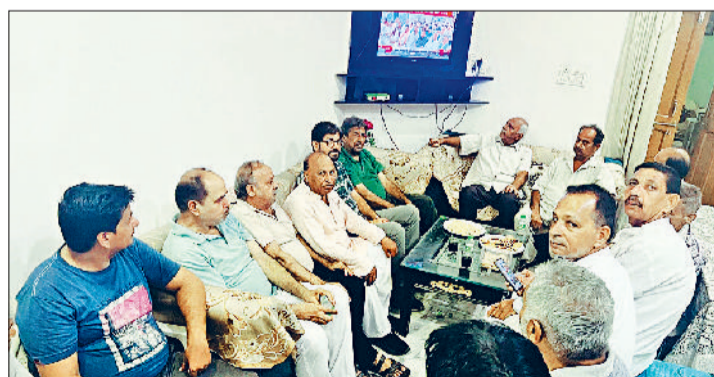
महम। प्रधानमंत्री नरेंद्र मोदी के मन की बात कार्यक्रम को सुनते भाजपा कार्यकर्ता।