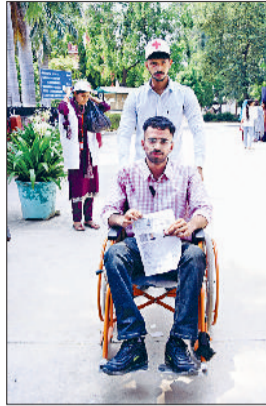
रोहतक। दिव्यांगों को परीक्षा केंद्र तक ले जाते वालंटियर।

यह बातें रोहतक के उन दिव्यांगजनों ने व्यवस्थाओं से प्रभावित होकर कहीं है, जो हरियाणा कर्मचारी चयन आयोग (एचएफएसएससी) द्वारा दूसरे दिन सामान्य पात्रता परीक्षा (सीईटी) देने के लिए विभिन्न परीक्षा केंद्रों पर पहुंचे थे। इन दिव्यांगजनों ने एक स्वर में कहा कि सरकार व प्रशासन द्वारा दिव्यांगजनों के लिए की गई बेहतर व्यवस्था उन्हें जीवन भर याद रहेगी। रोहतक के महम