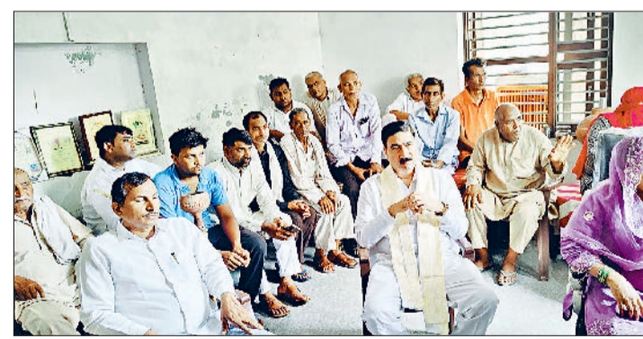
रोहतक। पीएम नरेंद्र मोदी के मन की बात कार्यक्रम को सुनते भाजपा कार्यकर्ता।