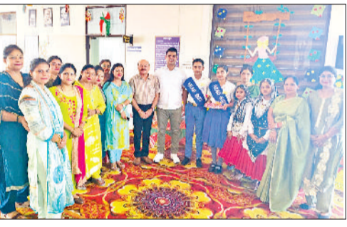
महम। तीज उत्सव में भाग लेते मॉडल स्कूल महम में विद्यार्थी व शिक्षक।