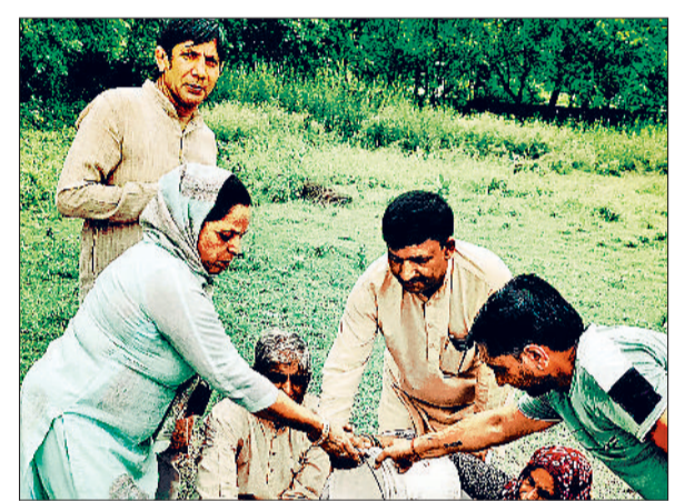
महम। सैमाण मंडल के एक गांव में पौधरोपण करते भाजपा कार्यकर्ता।